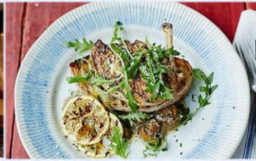
*Jamie's Italian：供應午晚餐，由名廚 Jamie Oliver 主理，打造正宗意式風味