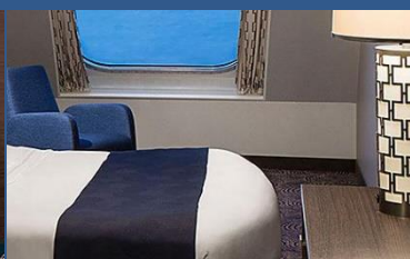
海景房：約 182 平方呎