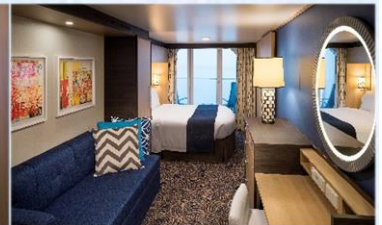
海景露台房 (1D/2D/3D/4D/5D)：198 平方呎