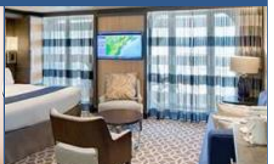
標準套房：連露台約 331 平方呎