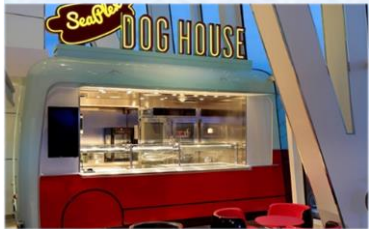
熱狗屋：品嚐不同風格的熱狗：紐約風格、芝加哥風、格或你的個人風格。