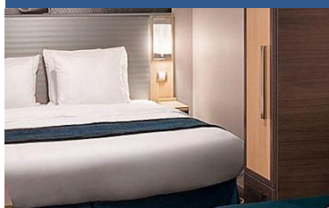
內艙房：約 166 平方呎