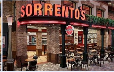
索倫托餐廳：供應午晚餐的意式 Pizza 美食