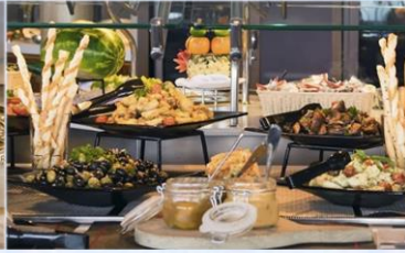
帆船美食廣場：供應早午晚三餐的環球美食自助餐