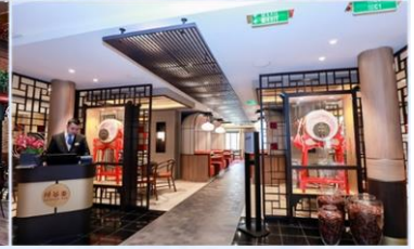
*川谷簞：供應午晚餐，品嚐正宗川菜風味