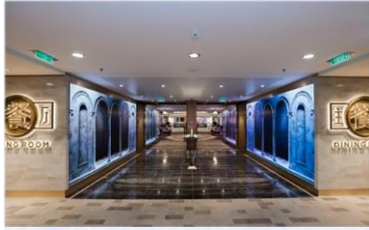
主餐廳：供應早午晚三餐的中西式美食