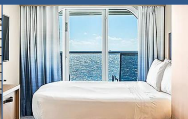
海景露台房：連露台約 253 平方呎