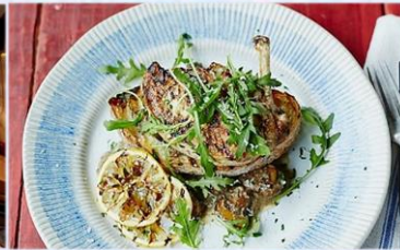
*Jamie's Italian：供應午晚餐，由名廚 Jamie Oliver 主理，打造正宗意式風味