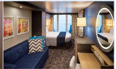
海景露台房 (1D/2D/3D/4D/5D)：198 平方呎