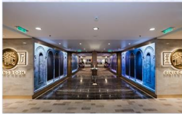
主餐廳：供應早午晚餐的中西式美食