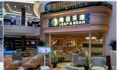
*咖話茶道：滿足各年齡層賓客，供應中國茶、咖啡等冷熱飲品，以及現烘中西式點心