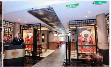
*川谷：供應午晚餐，品嚐正宗川菜風味