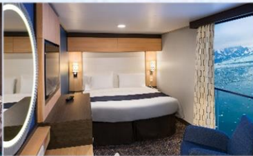
虛擬露台內艙房 (1U/2U)：166 平方呎