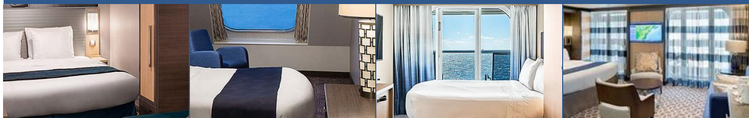
內艙房：約 166 平方呎