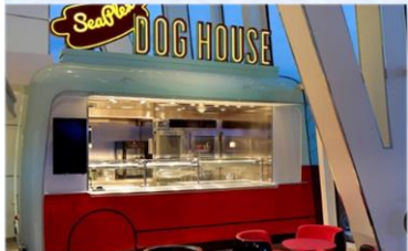
熱狗屋：品嚐不同風格的熱狗：紐約風格、芝加哥風、格或你的個人風格。