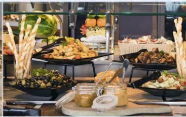
帆船美食廣場：供應早午晚餐的環球美食自助餐