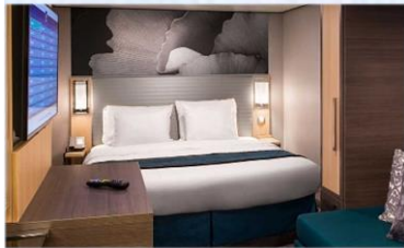
內艙房 (1V/2V/3V/4V)：166 平方呎