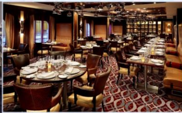
*美式扒房：供應午晚餐，品嚐傳統牛排餐廳的經典美食