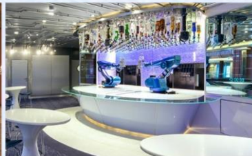
*機器人酒吧：科技感十足的機器人酒吧，輕鬆下達指令，即可調製專屬特飲