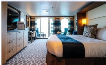
標準套房 (海際套房系列) (J1/J4)：276 平方呎