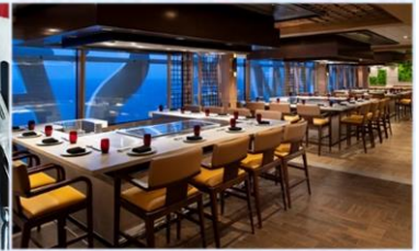
*日式鐵板燒：供應午晚餐，提供新鮮海產及頂級肉類，正宗日式美食應有盡有