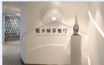
Sea Class 海際套房系列專屬餐廳