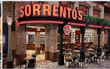
索倫托餐廳：供應午晚餐的意式 Pizza 美食