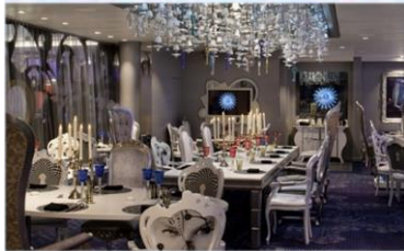
*大董意境坊：供應晚餐，與名店大董合作，體驗中國風的意境菜