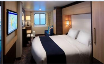
海景房 (1N/2N)：182 平方呎