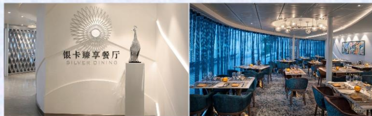
Sea Class 海際套房系列專屬餐廳