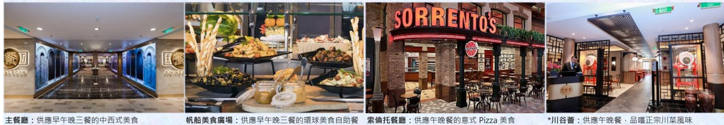
主餐廳：供應早午晚餐的中西式美食 帆船美食廣場：供應早午晚餐的環球美食自助餐 索倫托餐廳：供應午晚餐的意式 Pizza 美食 *川谷薈：供應午晚餐·品嚐正宗川菜風味