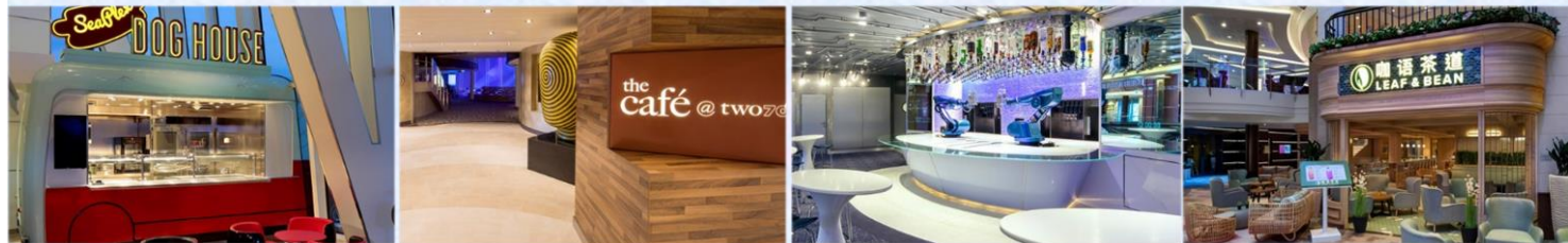
熟狗屋：品嚐不同風格的熟狗：紐約風格、芝加哥風 270 度咖啡廳：供應早午餐，品嚐多款熱三文治、格或你的個人風格。 自選沙律及自家製濃湯 *機器人酒吧：科技感十足的機器人酒吧，輕鬆下達指令，即可調製專屬特飲 *咖語茶道：滿足各年齡層賓客，供應中國茶、咖啡等冷熱飲品，以及現烘中西式點心