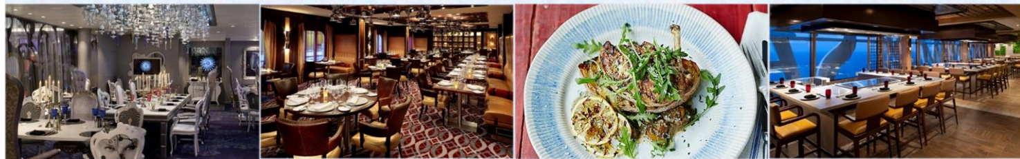
*大董意境坊：供應晚餐，與名店大董合作，體驗中國風的意境菜 *美式扒房：供應午晚餐，品嚐傳統牛排餐廳的經典美食 *Jamie's Italian：供應午晚餐，由名廚 Jamie Oliver 主理，打造正宗意式風味 *日式鐵板燒：供應午晚餐，提供新鮮海產及頂級肉類，正宗日式美食應有盡有