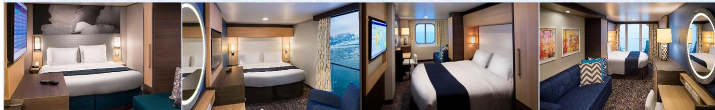
內艙房 (1V/2V/3V/4V)：166 平方呎 虛擬露台內艙房 (1U/2U)：166 平方呎 海景房 (1N/2N)：182 平方呎 海景露台房 (1D/2D/3D/4D/5D)：198 平方呎