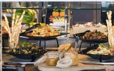
帆船美食廣場：供應早午晚餐的環球美食自助餐