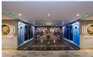
主餐廳：供應早午晚餐的中西式美食