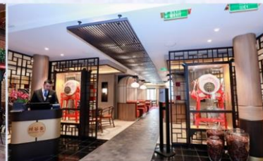
*川谷：供應午晚餐，品嚐正宗川菜風味