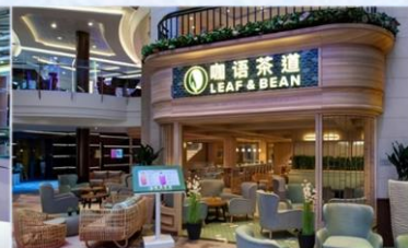
*咖啡茶室：滿足各年齡層賓客，供應中國茶、咖啡等冷熱飲品，以及現烘中西式點心