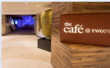
270 度咖啡廳：供應早午餐，品嚐多款熱三文治、自選沙律及自家製濃湯