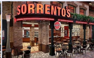
索倫托餐廳：供應午晚餐的意式 Pizza 美食