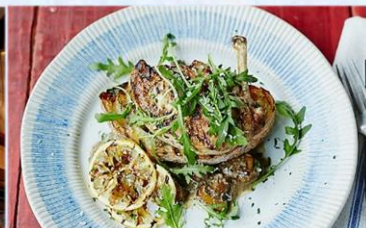
*Jamie's Italian：供應午晚餐，由名廚 Jamie Oliver 主理，打造正宗意式風味