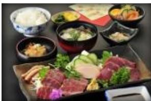
阿蘇馬刺身定食 每位2,620円 (稅別)