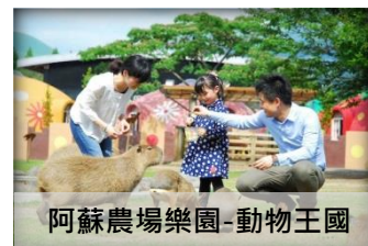
阿蘇農場樂園-動物王國

大約10萬年前，河流挾帶著阿蘇山的火山噴發產生的碎屑而來，熔岩冷卻後，再經五瀨川經年累月的侵蝕，形成今日高達百米絕美的斷崖。兩旁的柱狀岩石可以窺見阿蘇火山噴發的痕跡，總長度有7公里之長。