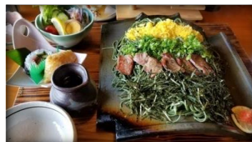
手打蕎麥麵 每位1,900円 (稅別)